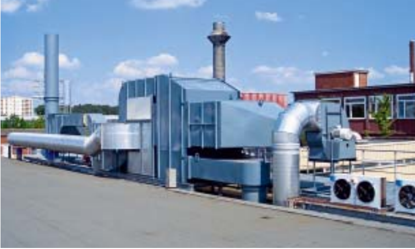
Außenansicht der lufttechnischen Anlage: Die Komponenten können einfach nachgerüstet und auch bei geringem Platzangebot – z. B. auf dem Hallendach – installiert werden

spielsweise der Wärmetauscher, nahezu wartungsfrei. Nach anfänglicher, genauester Beobachtung des Abluftfiltersystems durch den Betreiber wurden nach zweijähriger Betriebszeit die Wärmetauscherelemente demontiert, um auf eventuelle Beschädigungen und Verschmutzungen zu kontrollieren. Es wurden kei-